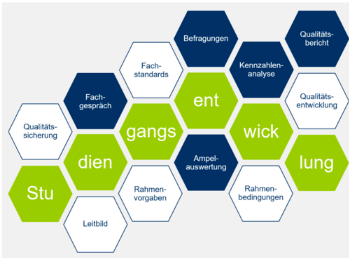
Abb.1 Komponenten und Instrumente für Studiengangsentwicklung an der FU (Ansprechperson für Fragen zu einzelnen Kacheln: Thorsten Grospietsch)